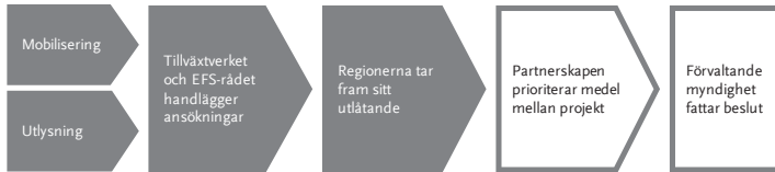
Figur 2 Steg i processen att bevilja EU-medel

I det här kapitlet beskriver och redovisar vi våra iakttagelser om hur Tillväxtverket, ESF-rådet, partnerskapen och regionerna i de olika partnerskapsområdena hanterar dessa inledande steg i processen: mobilisering, utlysning, myndigheternas handläggning och regionernas framtagande av sitt utlåtande.