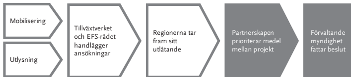
Figur 3 Steg i processen att bevilja EU-medel

I det här kapitlet beskriver vi och redovisar våra iakttagelser om hur partnerskapen bedriver arbetet med att prioritera medel mellan projekt, och hur det påverkar Tillväxtverkets och ESF-rådets beslut.