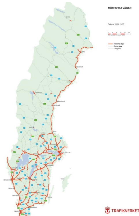
Bild 1. Motesfria vägar enligt Trafikverket 6 .

Tillgängligheten i Mittstråket är monumental för möjligheterna att kunna bo, leva och för företag och offentlig sektor att tillgodose arbetskraftsbehovet och transportera gods. Trafiksäkerhetsmålet nås enligt Trafikverket inte med planerade infrastrukturåtgärder och kommande fordonsutveckling. Det krävs även satsning på mötesseparering. Partnerskapet anser att det är positivt att Trafikverket ser behovet av ytterligare objekt för mötesseparering. Partnerskapet anser att valet av objekt bör återspegla ett mål om en nationell standard för europavägarna. Flertalet nationella stråk i landet är till stor del utbyggda och det regionala nätet i södra Sverige är mer utbyggt än det nationella nätet i norra Sverige. Partnerskapet anser därför att om det tillförs medel för att finansiera mötesseparerade vägar är det rimligt att prioritera stråk som till stora delar saknar mötesseparering. Dessa ligger till stora delar i Norrlands inland.