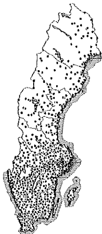
Bilaga 5: PostNords ombuds nät