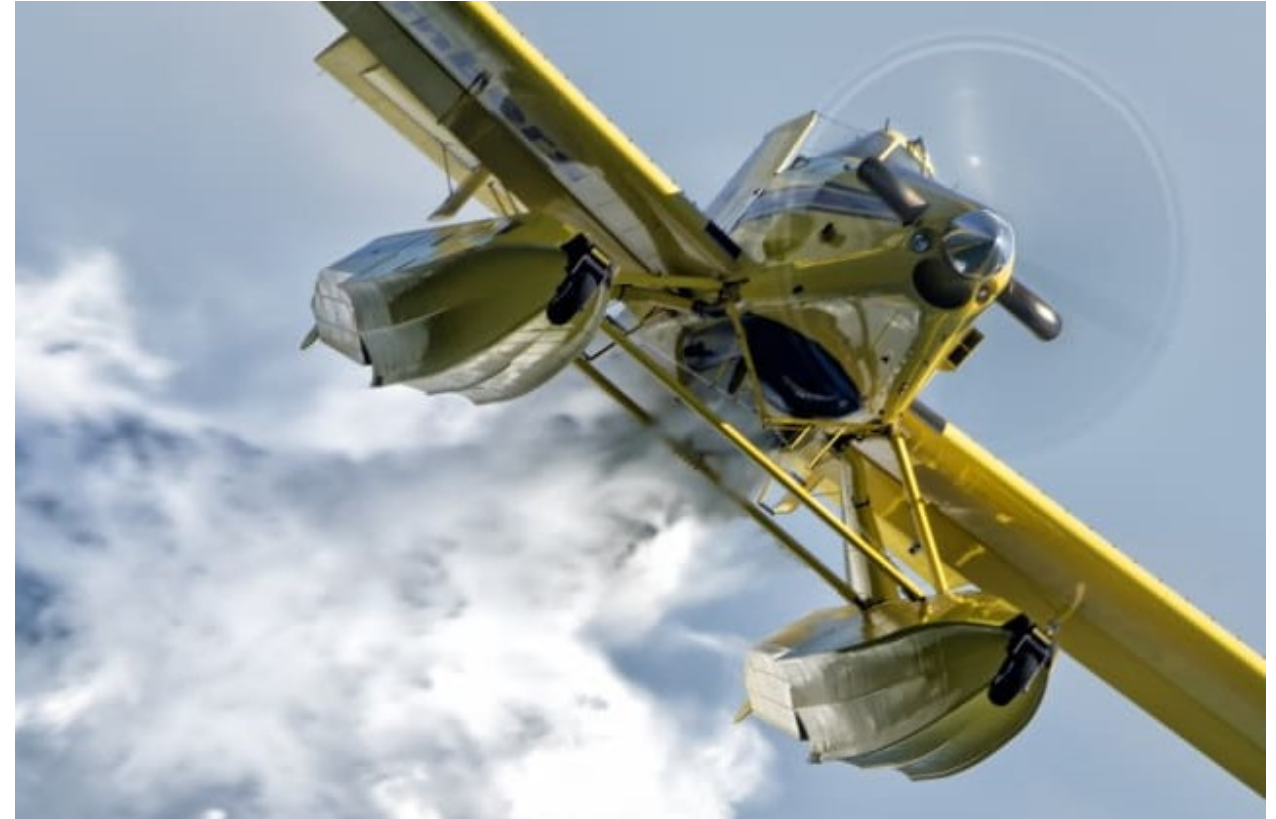
Flygplan av typen Air Tractor AT-802 Fire boss.