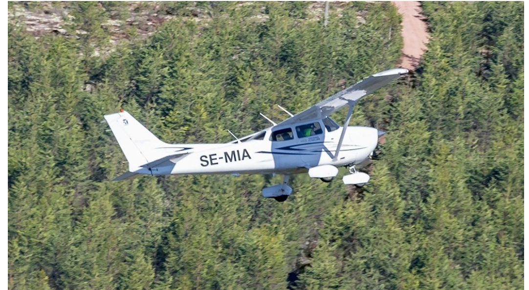
Ett skogsbrandsbevakande flyg ute på uppdrag.